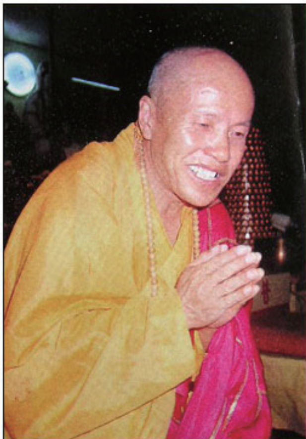
寬淨大法師在新加坡南海普陀山演講